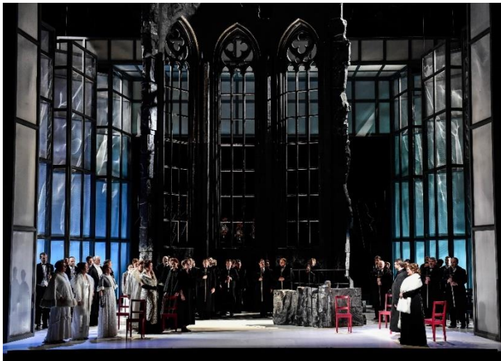
Scènefoto Tannhäuser tweede akte

Op zaterdag was Tannhäuser aan de beurt. Een probleem voor kleinere operahuizen lijkt het ensemble. Veel jonge zangers en enkele oudere, die meestal niet geloofwaardig gecast worden. Ook hier een veel te jonge Landgraf Hermann tegenover een te oude Tannhäuser en te mollige Elisabeth/Venus. Knap dat een sopraan beide rollen zingt, maar het zijn wel verschillende karakters! Dat kwam hier niet uit de verf. Regisseur Michael Heinicke had een multifunctioneel toneel bedacht: een muur met drie gotische kerkranken stond in het eerste bedrijf links en in het derde rechts. Ervoor een halfhoge glazen wand die tijdens het voorspel een in het zwart geklede Elisabeth in gebed toonde, en in het derde bedrijf een rood verlichte Venus. Wegens technische problemen begon de voorstelling 20 minuten te laat. De productie dateert van 2009 en we dachten even dat per ongeluk het decor van de Meistersinger was neergezet, maar dat bleek niet geval. De eerste akte was slaapverwekkend. Tannhäuser zag eruit als een verlopen zigeuner, zijn tenor was ook wat laag en klonk niet goed (verkouden? – het was bitter koud buiten), en Venus zong met heel veel vibrato. De Landgraf had een mooie stem en vooral