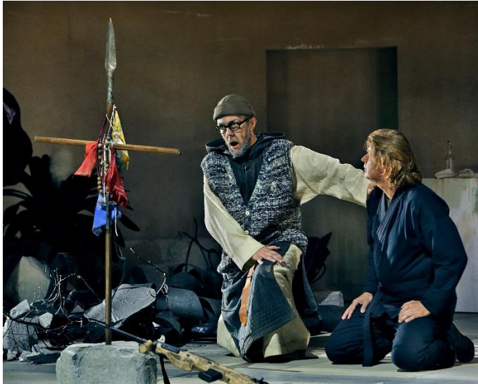
De versierde speer

twee stukken een kruis maken. De diepere betekenis is vermoedelijk dat Amfortas de speer heeft misbruikt. Het ding is een relikwie en geen wapen. Door hem te breken wordt de speer onbruikbaar gemaakt als wapen en herkrijgt de status van relikwie. Parsifal houdt de speer verder in de vorm van een kruis bij zich. Als hij opkomt in de derde akte ziet hij eruit als een marskramer in het kostuum van een gemaskerde commando. De speer hangt op zijn rug met een paar vlaggetjes eraan. Het geeft het geval een Tibetaans tintje. Het klooster is overwoekerd door planten, een beeld dat duidelijk is geïnspireerd door de jungletempel in Ankor Wat. We