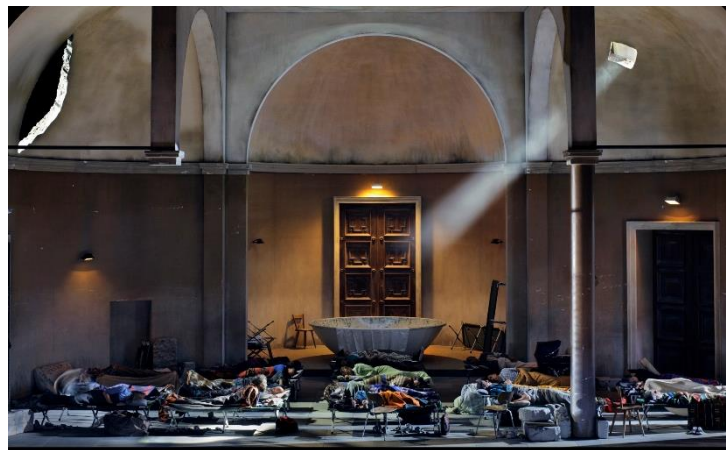
Het klooster als toevluchtsoord

Laufenberg blijft enerzijds dicht bij de tekst maar gaat anderzijds een stap verder. Het uitgevoerde ritueel is namelijk niets minder dan een bloedoffer. Amfortas wordt verwond en verliest zoveel bloed dat hij na korte tijd in een grote plas lijkt te liggen. We zien een soort wonderbaarlijke