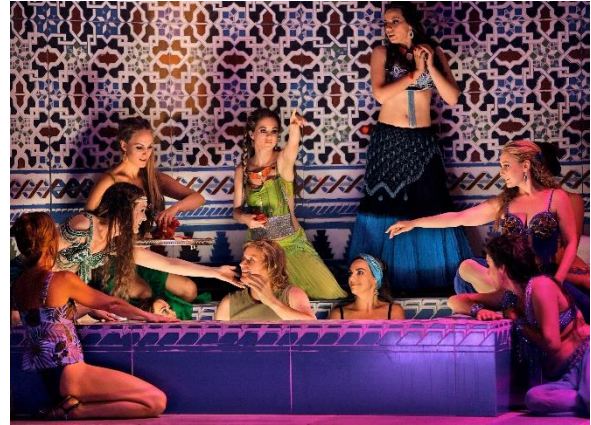
Parsifal in de hamam

vermenigvuldiging, niet van broden en vissen maar van bloed. Om beurten drinken de ridders er een slok van. Onduidelijk blijft of het bloed inmiddels in wijn is veranderd. Aangezien Amfortas daarvoor opvallend kwiek rondstapte, wordt de indruk gewekt dat er sprake is van het opnieuw openen van zijn wond. Met als gevolg dat zijn lijden weer een aanvang neemt.