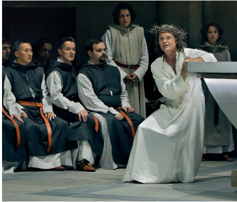
Parsifal Bayreuth 2016

Samenstelling en toelichting: Paul Korenhof