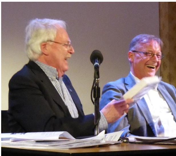
Een cadeautje voor de scheidende penningmeester