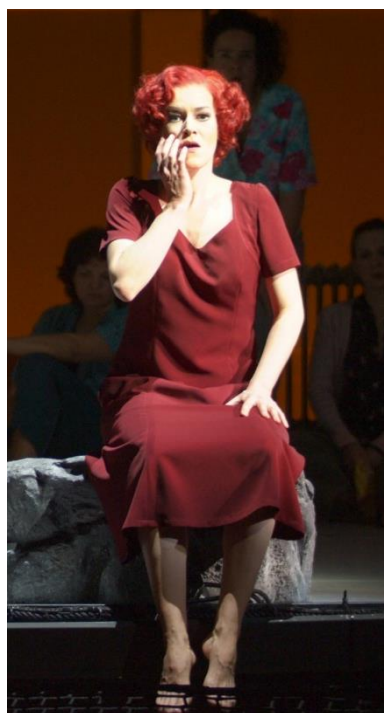
Senta in rode jurk en met rode pruik