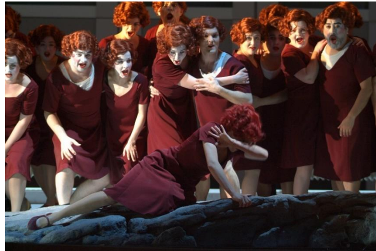
Matrozen in rode jurk en met rode pruik

moest vanaf het moment dat ze begon met zingen haar hele rol zeer fysiek neerzetten. Dat ging heel vaak goed en soms klikte het net niet. Stom he, dan raak ik dus meteen uit het verhaal en val ik terug in de rol van collega: waarom ziet het er nu plots zo vreemd uit dat ze over het podium tolt terwijl ze net nog totaal geloofwaardig tegen een rots aan klauwde. En is ze niet duizelig? Oh en dan, waarom zingt die lieve mevrouw zo zacht de hele tijd? Het leek in mijn oren net alsof ze de motor op die manier niet lekker aan kon houden en soms per zin meerdere keren opnieuw een beetje gas moest geven, in plaats van een constante stroom die binnen de gebruiksgrenzen fluctueert. Maar he, wie ben ik, ik wáág me nog niet eens aan Senta.