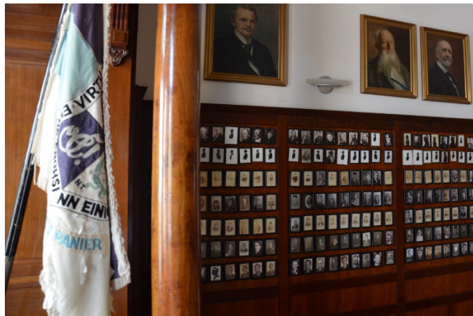
Het Lebensbundprincipe tastbaar in het huidige huis van Corps Saxonia