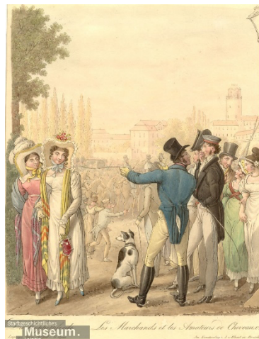
Studenten te Leipzig, wellicht van Corps Saxonia

duiding van de verschillen tussen dergelijke Duitse studentenverenigingen voert veel te ver voor dit betoog. Belangrijk is wel om te onthouden dat de Duitse studentenclubs klein bleven, en zich ten opzichte van de Nederlandse corporale verenigingen tevens onderscheidden in een aantal kenmerkende opzichten, zoals hun Lebensbundprinzip en Ehrencodex . Het eerste betekent dat de student, eens als lid toegelaten, voor het leven met diens vereniging verbonden blijft, na diens afstuderen als ‘Alter Herr’ (het hele systeem was, en is voor een deel nog steeds, ingericht op de manlijke student; van diversiteit en inclusie was al die decennia geen sprake). Het tweede houdt in dat ieder lid te allen tijde de verplichting heeft de eer van hem en de zijnen te verdedigen. 9 Ook onderscheiden de Duitse traditionele verenigingen in het dragen van kleuren (veelal met een sjerp) en – bij formele gelegenheden - op uniformen gelijkende kledingstukken. En in het uitvechten van duels op de sabel, vroeger ter verdediging van de eer, tegenwoordig nog bij een aantal corpora en Burschenschaften als voorwaarde van lidmaatschap, een zogenaamd Bestimmungsmensur (waarover in deel twee van dit artikel meer 10 ). En aan zo’n ereduël zou Wagner dus wellicht hebben meegedaan?