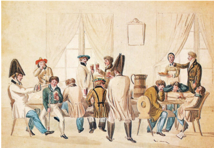
Corpsstudenten in hun 'Kneipe' rond 1810

er in Leipzig twee andere studentenverenigingen: het in 1807 opgerichte, en daarmee oudere, Corps Lusatia en de in 1818 opgerichte Leipziger Burschenschaft Germania. 21 Het oudste corps, Lusatia, werd gesticht door een aantal studenten afkomstig uit de Lausitz, een gebied dat zich grofweg uitstrekt rondom de stad Cottbus, voor een deel ook in huidig Pools gebied. Saxonia, de vereniging die Wagner verkoos, werd op 4 september 1812 als Landsmannschaft Saxonia Leipzig opgericht door zeven leden van de Landsmannschaft Thuringia Leipzig, drie leden van de Corpslandsmannschaft Saxonia Jena en twee leden van de Corpslandsmannschaft Austria aan de Universiteit van Leipzig. Vanaf 1822 werd zij Corps Saxonia genoemd.