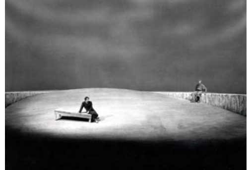
Tristan und Isolde (Bayreuther Festspiele, 1952)

Toen Parsifal en de Ring in 1951 in Bayreuth in première gingen, waren dat historische producties. Wieland Wagner had in zijn regie een revolutionair verlichtingsplan ontworpen waarnaast uiterst sober gebruik werd gemaakt van decorstukken. In de enscenering speelde de verlichting eigenlijk de hoofdrol. Met zeer weinig decorstukken kwam het accent en de beeldingskracht te liggen op specifieke uitlichting, kleurgebruik en het doceren van de lichtsterkte naast natuurlijk de expressie en bewegingen van de solisten. Het gebruik van lichtontwerpen met een minimalistisch toneelbeeld, werd 'entrümpelung' genoemd.