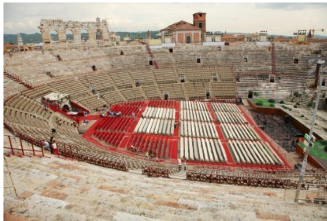
De Arena van Verona

Het was duidelijk dat er voor grootschalige producties met omvangrijke koren als Aida en Nabucco geen plaats was, maar welke locatie was nu geschikter voor een uitvoering waarbij toeschouwers en medewerkers afstand moeten houden dan het reusachtige Romeinse overblijfsel. Het parket, het vlakke gedeelte onderin de arena waar zich normaal de dure zitplaatsen bevinden, was helemaal vrij gemaakt voor het orkest dat op die manier onderling afstand kon houden. En op de Gradinata, de stenen treden voor het minder draagkrachtige publiek, konden toch altijd nog zo'n 2000 toeschouwers worden ondergebracht.