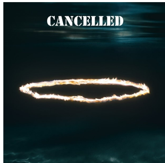
In november en december vonden alsnog twee concertante uitvoeringen van de Parijse Ring plaats.

De opera van Parijs had twee cycli van de Ring gepland inclusief een uitgebreid randprogramma. Dat ging ook niet door, maar helemaal annuleren wilde men toch ook niet. De geënceneerde voorstellingen werden heel optimistisch omgezet in concertante uitvoeringen, een keer in de Bastille eind november en een keer bij Radio France kort daarna. De bezetting bleef hetzelfde. Helaas. De Franse regering besloot in oktober dat de theaters gedurende de hele maand november gesloten moesten blijven en daarmee verviel ook die optie. Daar wilde het theater zich toch niet klakkeloos bij neerleggen. Op 29 oktober werd bekend gemaakt dat de Ring mogelijk via een streaming uitgezonden zou worden en dat de uitvoering bij Radio France later in december misschien alsnog zou plaatsvinden. Hoe dat is uitgepakt was bij het schrijven van dit artikel nog niet bekend.