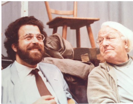
Giuseppe Sinopoli met Wolfgang Wagner

In Bayreuth had hij de muzikale leiding over Tannhäuser (1985-1989); Der Fliegende Holländer (1990-1993); Parsifal (1994-1999) en ten slotte de Ring des Nibelungen (2000).