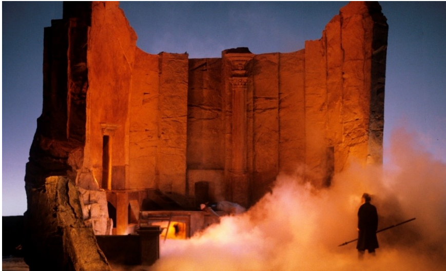
Scènefoto 3 e akte Die Walküre . Wotan bij de Brünnhildefels.

Zangers die in 1976 waren geëngageerd zijn verderop in de vijf jaar dat deze Ring was te beleven, opgestapt uit onvrede met deze enscenering. Chéreau hechtte grote waarde aan de acteerprestaties van de zangers. Het acteren, de actie op het toneel en de interactie tussen de diverse personages vormen een belangrijke attractie. Misschien is ook dat wel een van de redenen geweest dat deze productie in de jaren