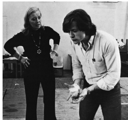
Chéreau regisseert Brünnhilde (Gwyneth Jones)