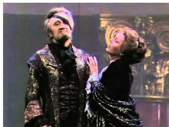
Wotan en Fricka 2 e akte Die Walküre