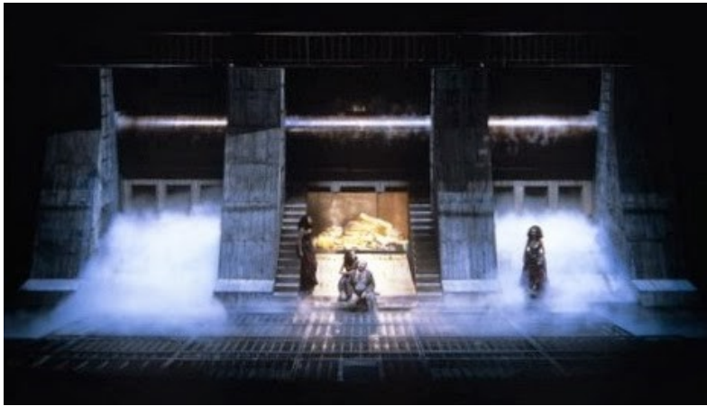
Scènefoto Das Rheingold