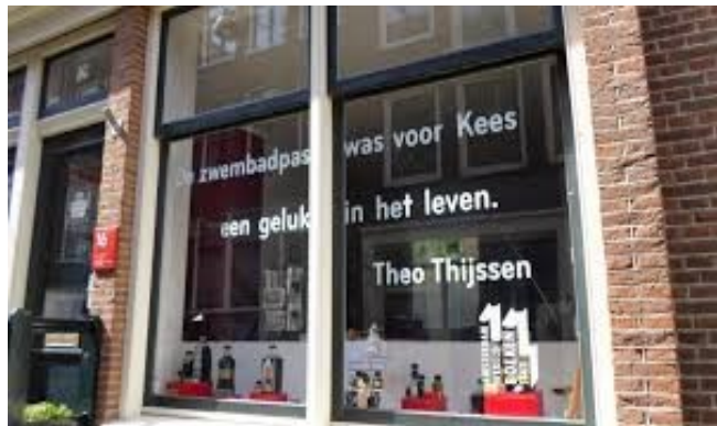
Het Theo Thijssenmuseum