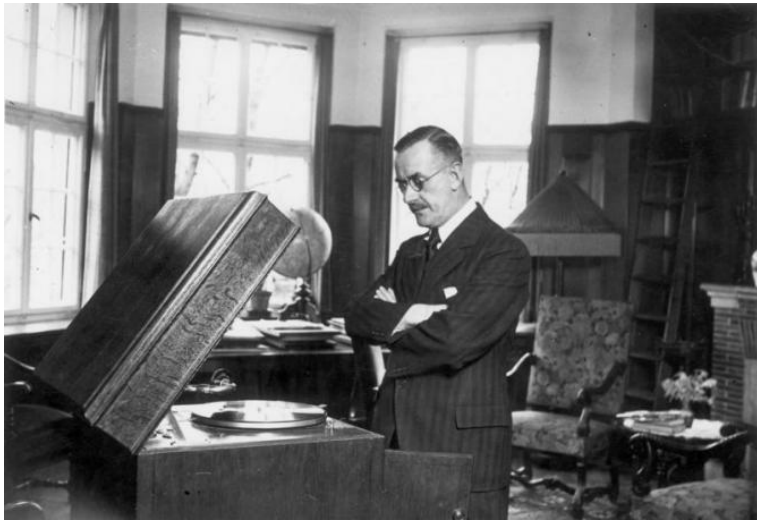
Thomas Mann (1875-1955) in 1932

ein Vortrag über einen Vortrag ist schon etwas Besonderes, erst recht, wenn es sich um Thomas Mann, um München und um Richard Wagner handelt. Noch dazu haben wir es mit einem europäischen Thema zu tun, es geht mit dem Vortrag 1933 nach Amsterdam, Brüssel und Paris, 1934 nach Zürich, Basel und Bern und 1935 nach Prag, Wien, Budapest und Salzburg. Der Europäer Thomas Mann zeigt sich von seiner besten Seite, eine Seite, die mit dem Wagner-Vortrag bislang nicht ausdrücklich in Verbindung gebracht wurde.