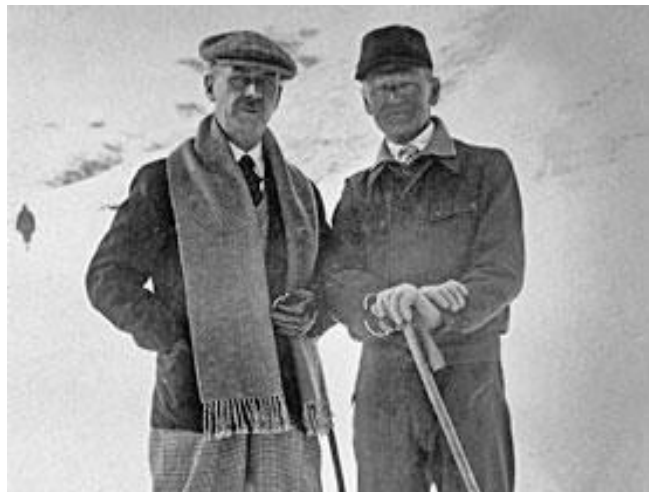
Mann met Hesse in Zwitterland, 1931

Aus der „Vorwegnahme der Psychoanalyse“ wird im „Protest“ also die „Fundgrube“, die Dilettantismus-Stelle ist korrekt wiedergegeben, aber bei dem „Zugleich von Deutschheit und Modernität“ ist sowohl dem Referenten der Vossischen Zeitung als auch dem ihm folgenden Münchener Generalmusikdirektor ein bezeichnendes Missverständnis unterlaufen. Thomas Mann betont bei Wagner „das grandiose Zugleich und Ineinander von Deutschheit und Mondänität“, nicht Modernität. Seine „Deutschheit“ zeichne eine „Weltgerechtigkeit, Weltgenießbarkeit (aus), wie sie keiner deutschen Kunst dieses Ranges je mitgegeben wurde“.