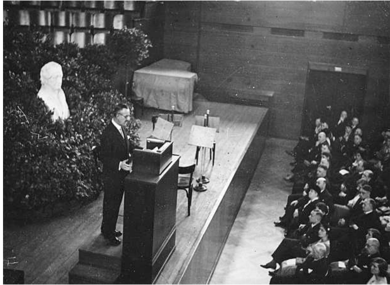
Thomas Mann tijdens een Goethe lezing in Weimar, Goethe-Jahr 1932

Tatsächlich und nicht nur oberflächlich, sondern mit Leidenschaft und Bewunderung hingeblickt, kann man sagen, auf die Gefahr hin, missverstanden zu werden , dass Wagners Kunst ein mit höchster Willenskraft und Intelligenz monumentalisierter und ins Geniehafte getriebener Dilettantismus ist. Die Vereinigungsidee der Künste selbst hat etwas Dilettantisches und wäre ohne die mit höchster Kraft vollzogene Unterwerfung ihrer aller unter sein ungeheures Ausdrucksgenie im Dilettantischen stecken geblieben. Es ist etwas Zweifelhafte um seine Beziehung zu den Künsten; so unsinnig es klingt, haftet ihr etwas Amüsantes an.