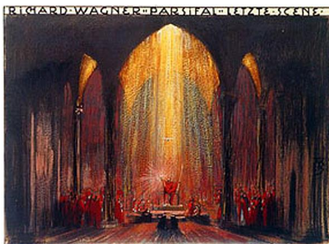
Decorontwerp Parsifal Alfred Roller