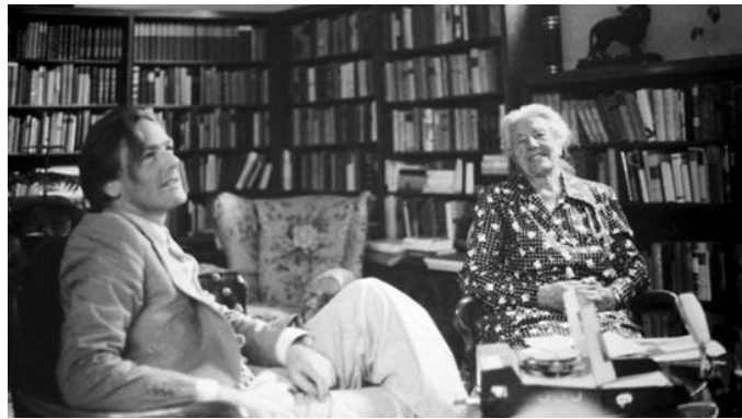
Hans-Jürgen Syberberg en Winifred in 1975