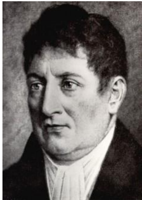
Johann Gottlieb Fichte

Schopenhauer's antwoord ligt in het bekende concept van de Wil. Net als Fichte en Schelling geloofde Schopenhauer dat er één originele oerkracht was, waaruit de tweedeling tussen subject en object voortkwam. Deze oerkracht was de wereld-Wil. De Wil is te identificeren met het Kantiaanse noumenon: een onderliggende realiteit voor de wereld zoals het subject hem beleeft. Maar er is een groot verschil: de Wil manifesteert zich ook in de mens, en daar staat hij bekend als in de individuele wil. De mens, als subject, beleeft de wereld-Wil als object (als de belevingswereld), maar ook in zichzelf. De metafysische Wil beweegt ons allen op deze manier voort: het is een altijd doorgaande activiteit, een eeuwig en oneindig streven. Het streeft naar iets onbereikbaars en is daarom nooit tevreden.