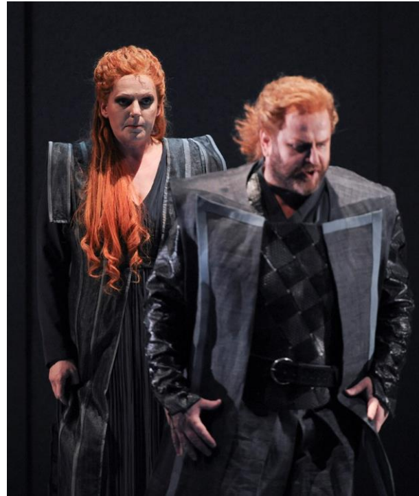
Isolde (Eva-Maria) en Tristan (Frank) in de Semper Oper

(19:30 uur: Muziekcentrum Splendor, Nieuwe Uilenburgerstraat 116, Amsterdam-C.)