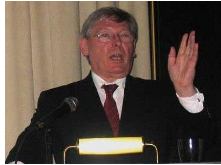
Dr. Oswald Georg Bauer

De geschiedenis van de Festspiele wordt jaar voor jaar behandeld, waardoor er een volledige kroniek ontstaat met talrijke afbeeldingen van alle uitgevoerde enceneringen. Het begint met de eerste ideeën over een Festspielhaus in het jaar 1850, gevolgd door de bouwfase van het theater en de eerste Festspiele in 1876, om daarna alle voorstellingen van elk jaar tot het jaar 2000 te behandelen. Elke afzonderlijke encenering en zijn ontvangst in de pers wordt uitvoerig beschreven en geïllustreerd. De periode vanaf 2000 wordt beperkter behandeld.