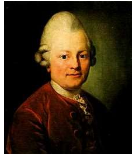
Gotthold Ephraim Lessing

In deel 2 (Het theater en het wezen van de dramatische dichtkunst) zet Wagner zich af tegen het werk van de Duitse schrijver en dichter uit de Verlichting Gotthold Ephraim Lessing (1729-1781). Met de ideeën van Lessing zou het synthetische kunstwerk nog verder uiteenvallen. Voorts wijst Wagner op de tegengestelde richtingen van Shakespeare en Racine en van Schiller en Goethe. Overigens vindt hij dat het Duitse drama noch bij Schiller noch bij Goethe zijn vorm heeft gevonden. Voor de uiteindelijke vorm die het theater zou moeten krijgen, vindt Wagner het verlossende woord in de mythe: de authentieke schepping van de volkscultuur en ook de authentieke kern van het volksbewustzijn. Voor het overbrengen van authentieke menselijke waarden is de mythe nodig. Wagner gaat op zoek naar hoe de mens in zijn meest authentieke verschijning op het toneel kan worden gebracht.