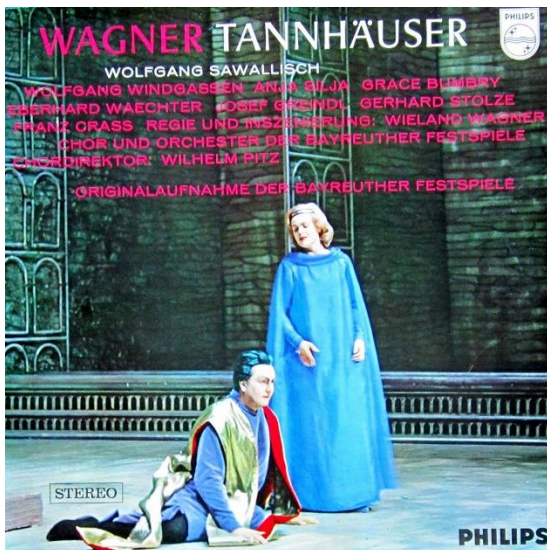
Anja Silja met Wolfgang Windgassen 1962

Dat deze productie van Lohengrin in 1962 nog eens werd hernomen, zou te maken hebben gehad met