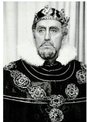
Gottlob Frick als Philips II

Met bovenstaand referentiekader kan u nu zelf rollen indelen. Probeer het eens met Brighella (das Liebesverbot), het orakel (la voce uit Idomeneo), Philips II (Don Carlo), Dikoj (Katja Kabanova) en heel actueel Porgy (Porgy and Bess).