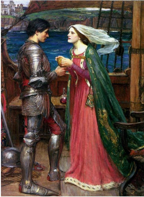
Het drinken van de Liebestrank