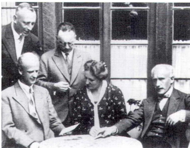
Furtwängler en Toscanini tegelijkertijd in Bayreuth 1931

In een relaas over deze twee dirigenten in Bayreuth moet het incident worden genoemd dat plaats had op 4 augustus 1931, een jaar nadat Siegfried Wagner overleed. Furtwängler had als artistiek directeur bepaald dat hij het Festspielorchester in een puur Beethoven concert zou dirigeren. Winifred vond een