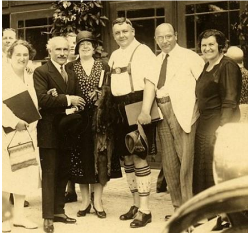
Toscanini in Bayreuth

De medewerker is aanwezig bij een repetitie voor de nieuwe productie van Tannhäuser .