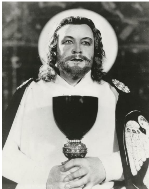
Melchior als Parsifal

‘In dit opzicht kan Bayreuth ook dezen keer een buitengewoon succes boeken: de jonge Deense tenor Lauritz Melchior, die de rollen van Siegmund en Parsifal vertolkte. Ziedaar weer een heldentenor! Groot,forsch,veerkrachtig zijn figuur; één glanzende welluidendheid zijn stem; donker-fluweel in het fluisteren, stralend in het uitstroomen, steeds warm, nooit hard of geforceerd: de ware zangtoon, die de ééne snaar doet trillen. Het timbre is eenigszins baritonaal getint en herinnert aan Urlus. Het spel is nog niet geheel af, maar reeds thans beschikt het over het groote dramatisch gebaar. Slechts één voorbeeld. Siegmund's noodkreet ‘Wälse wo ist dein Schwert’: het langzaam opheffen der beide armen tot hoog boven het hoofd in volkomen overeenstemming met het geweldige aanzwellen der stem: dit zijn oogenblikken waarin onze verbeelding ongestoorde werkelijkheid wordt.’