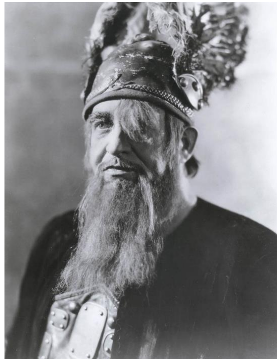
Friedrich Schorr als Wotan in de Met

https://www.youtube.com/watch?v=6pLu2Y7I8iQ