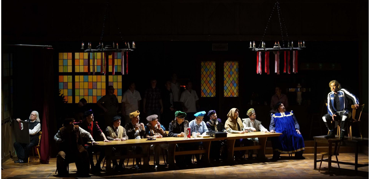
Hessisches Staatstheater Wiesbaden – Die Meistersinger von Nürnberg