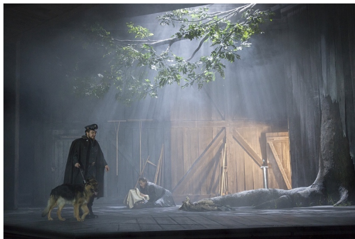
Oldenburgisches Staatstheater, Die Walküre