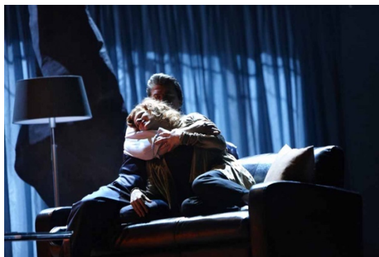
Deutsche Oper: Tristan und Isolde