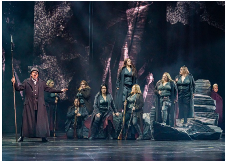
Finse Nationale Opera, Die Walküre